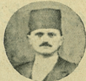
Kibarzade Ahdullah Hilmi Helal Tuhafiye Ticarethanesi

تلغراف آدره سی : قسطنونیده کبار زاده عبداه