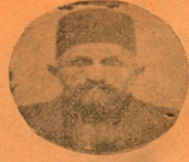
Hacı Kuzuzade ve Mahdumları Manifatura vs. Tüccarı